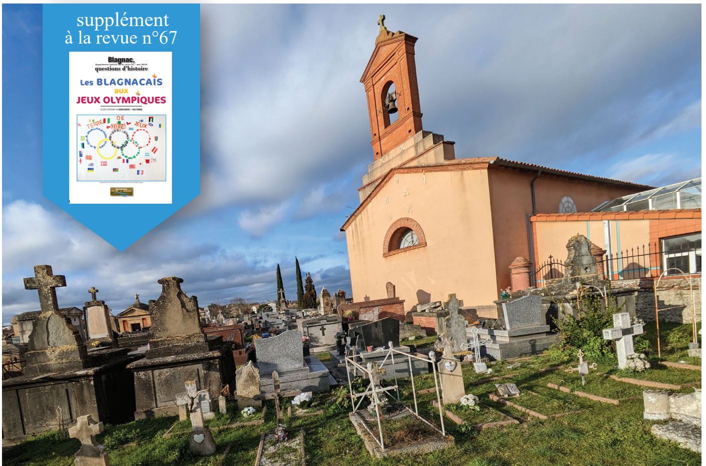
La chapelle Saint-Exupère et le cimetière centre de Blagnac : au premier plan, le carré des enfants