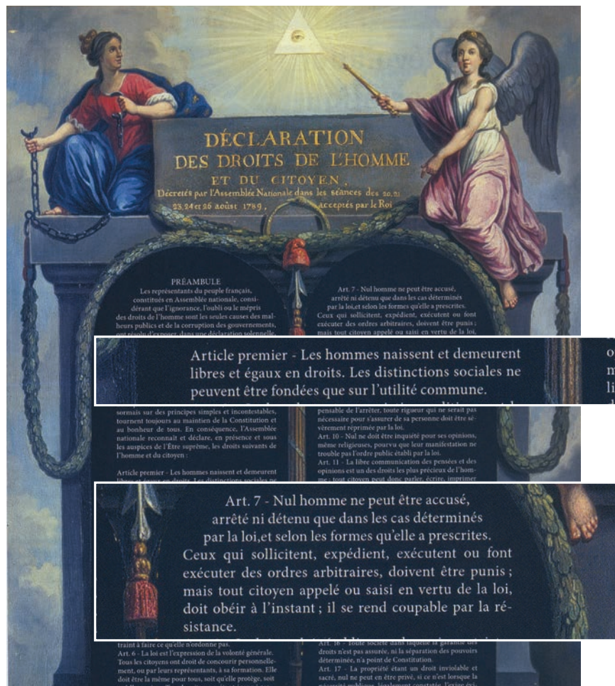
Article premier de la Déclaration des droits de l'homme et du citoyen

On demande un prix uniforme pour le sel et le tabac dans tout le royaume, plus tard l'unification des poids et des mesures sera aussi une revendication nationale.