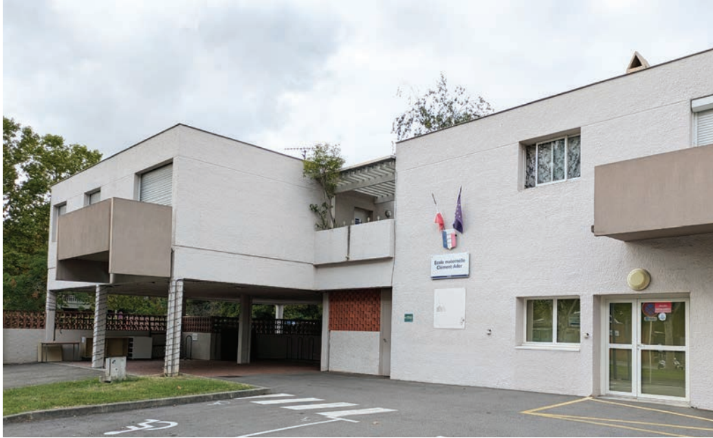
École maternelle Clément Ader, vue extérieure

La dépense inscrite, comme déjà dit, aux budgets primitifs de 1976 et 1977 est assurée par une subvention de l'État de 509 301 francs, une du département de 193 046 francs, par un emprunt de 509 301 francs auprès de la Caisse d'Épargne remboursable en 30 annuités à partir de 1978, au taux en vigueur au moment de l'établissement du contrat et enfin par un autre emprunt pour le complément auprès de la Caisse des Dépôts.