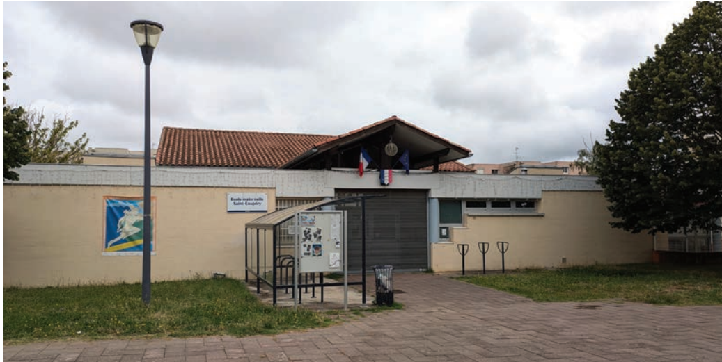
École maternelle Saint-Exupéry, vue extérieure