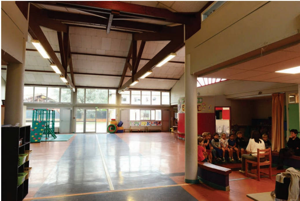
Vue intérieure