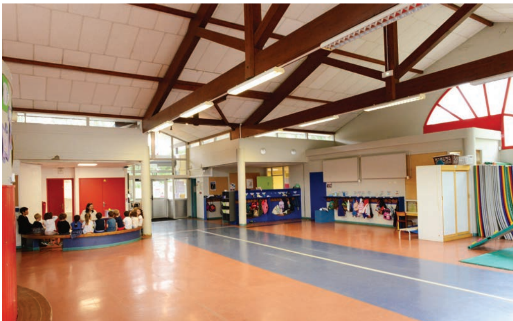
Vue intérieure