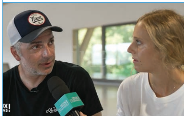
Photo : Alexis Jauzion interviewé pour l'émission de télévision « Aux Jeux citoyens »

(Skateboard 31 et sélectionneur de l'équipe de France de Skate)