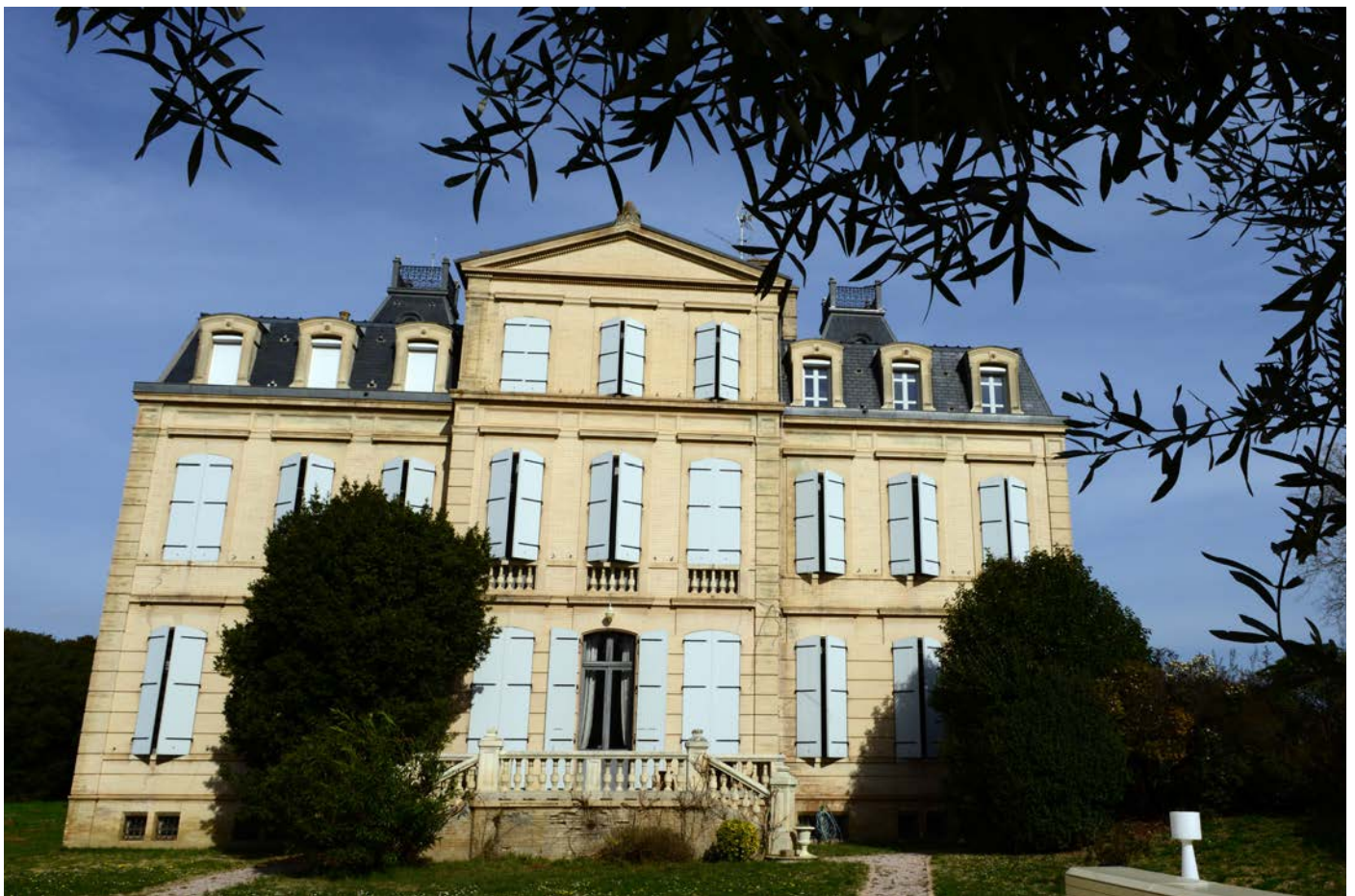
La façade sud du château du Ferradou

Marcel Clouet, un héros de la Résistance