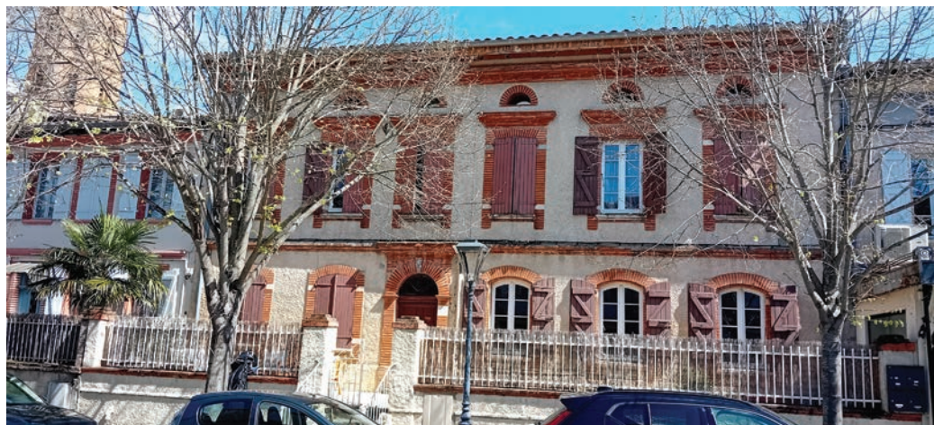
La maison du 8 boulevard Jean-Rivet

Acquise en 2018 par l'association « L'Arche en Pays toulousain », cette demeure est devenue deux ans plus tard, après travaux, un habitat partagé où résident aujourd'hui, au rez-de-chaussée et au premier étage, dans des logements de type T2, cinq personnes, dont quatre accueillies à L'Arche et travaillant à l'ÉSAT Maniban, et une retraitée qui était déjà locataire des anciens propriétaires. Les habitants disposent également d'une grande salle commune. A l'arrière de la maison, un grand volume sur terre battue, appelé « garage », donne sur la rue de l'Église ; autrefois équipé de mangeoires, il a abrité des animaux et, paraît-il, servi de relais de chevaux. La pièce située au-dessus du garage a probablement servi de grange.