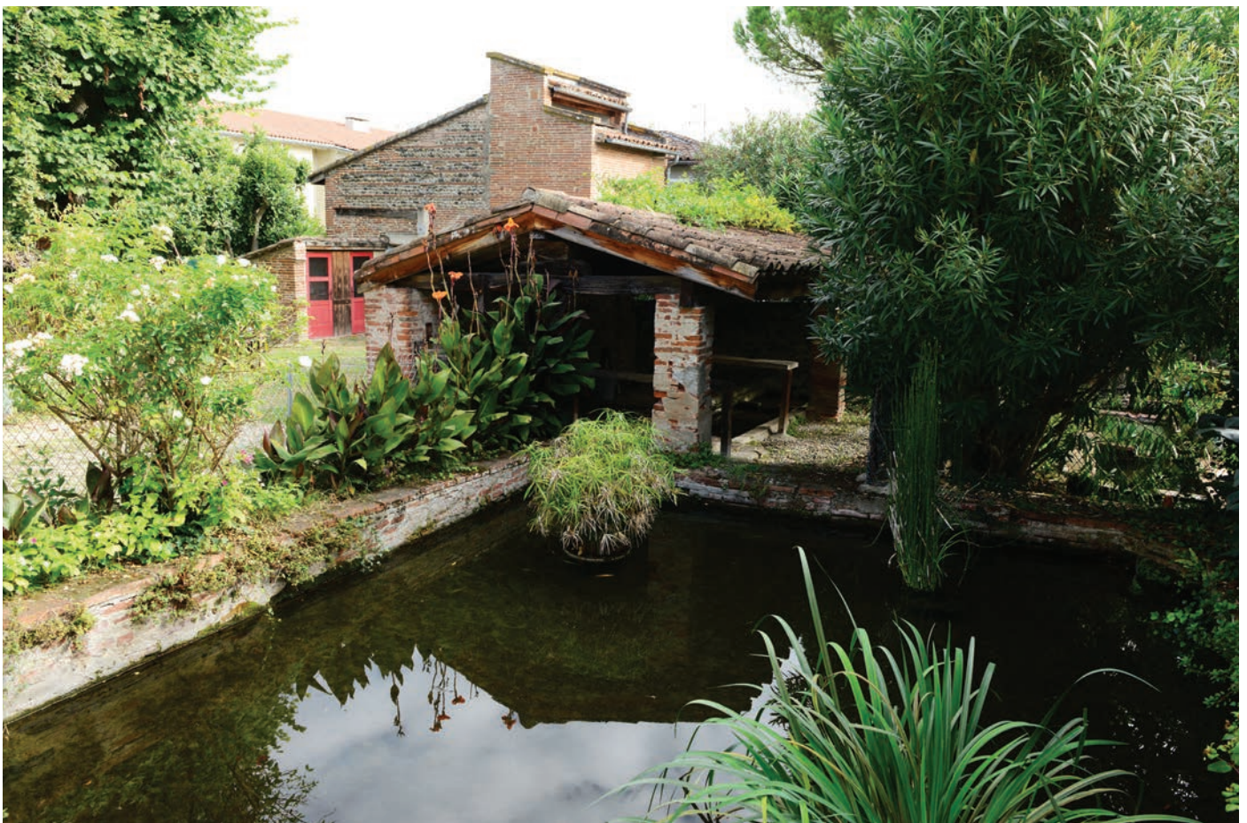
Le pesquier (en occitan) dénommé « le vivier du baron »