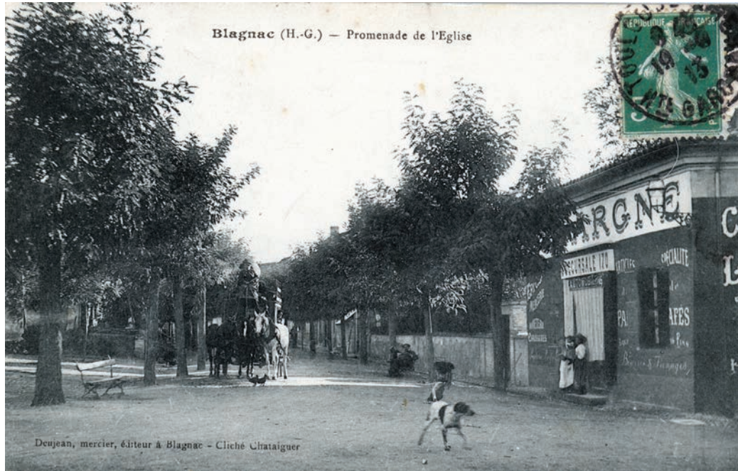
La diligence passant par la Promenade de l'Eglise

C'est à cette même époque où la mairie-école voit le jour qu'une grande opération d'urbanisme débute, par la volonté de la municipalité de dégager la vue sur l'église en achetant et en démolissant les maisons lui faisant face, suite à l'établissement d'un plan d'alignement en 1868.