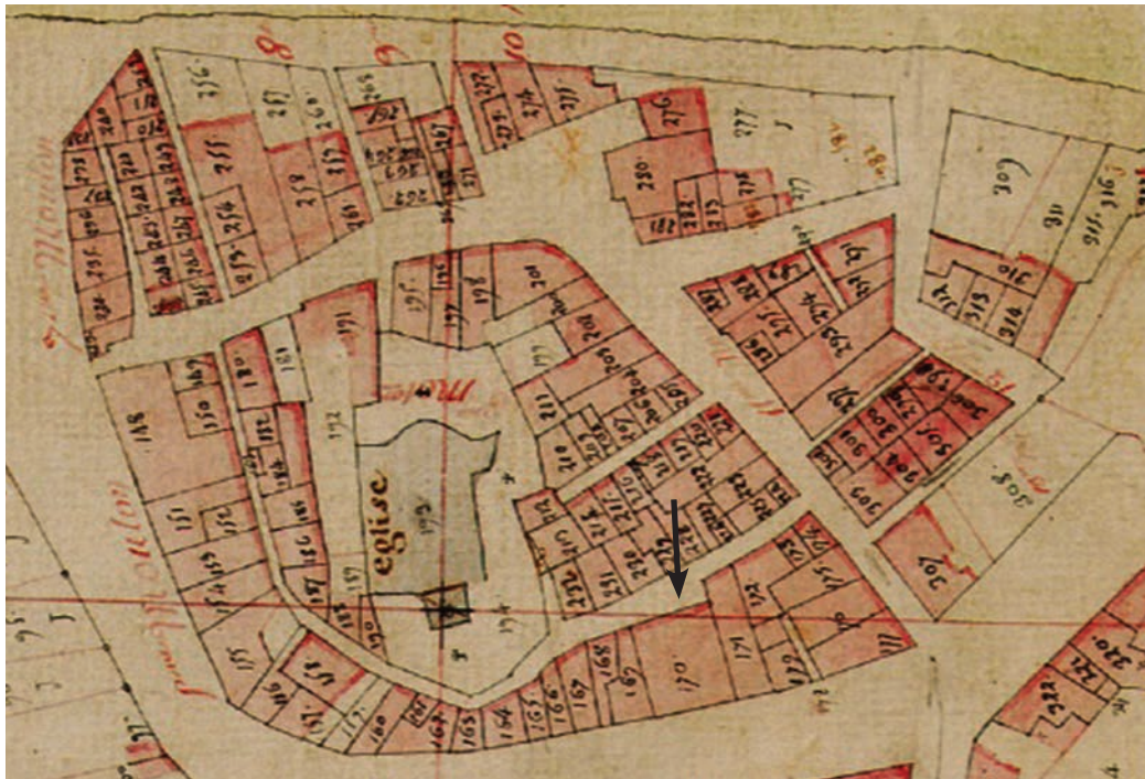
La parcelle H170 sur le plan cadastral de 1809 (Archives départementales de la Haute-Garonne).

Avec la destruction du rempart et la création de la Promenade publique, l'entrée principale de la maison va se retourner vers l'extérieur du bourg historique et donner donc désormais sur la Promenade. La taxation au XIX e siècle du nombre des portes et fenêtres des habitations nous permet de suivre l'évolution de la maison, qui passe de trois ouvertures vers 1810 et quatre vers 1830, à sept dans les années qui suivent puis quinze au début des années 1840, avant de redescendre à treize de 1850 à la fin du siècle. Il semble donc que l'on puisse considérer l'allure de la maison fixée dans ses grandes lignes dans les années 1840-1845 : sa configuration et son architecture extérieures actuelles dateraient donc en grande partie du milieu du XIX e siècle. La création de la terrasse est du reste, comme on l'a vu, contemporaine de ces remaniements, vers 1843. Ce n'est sans doute pas une coïncidence si les grandes évolutions architecturales que l'on devine derrière le doublement du nombre des ouvertures interviennent juste après l'accession de Marie Martine Bessières épouse Durand à la propriété de la maison, laquelle faisait d'ailleurs à l'époque office d'école – nous y reviendrons.