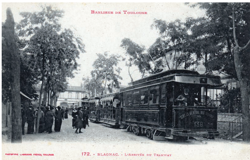
Le tramway stationnant devant la maison

Les liaisons avec Toulouse sont facilitées par la diligence, « l'omnibus », qui passe devant la maison entre 1870 et 1914, année où est inauguré le tramway, dû à l'action de Firmin Pons et qui a, comme la diligence, son terminus devant l'église en stationnant devant la maison. Sur les cartes postales anciennes, on devine la maison ou plutôt on aperçoit surtout les marches menant à sa terrasse. Le tramway disparaît au lendemain de la Seconde Guerre mondiale. Le boulevard, dont le revêtement est passé du gravier originel