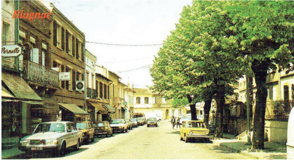
A l'ère de la voiture : le boulevard Jean-Rivet

L'ancienne Promenade publique ou Promenade du village est devenue officiellement (mais pas forcément dans l'usage quotidien) « boulevard du Centre » dans la seconde moitié du XIX e siècle, avant qu'au siècle suivant boulevard du Centre et boulevard du Nord soient réunis pour former le boulevard Firmin-Pons. Enfin, au milieu du XX e siècle, le tronçon autrefois dénommé « du Centre » prend (curieusement sans décision en conseil municipal) l'appellation de « boulevard Jean-Rivet », du nom du maire de Blagnac en fonctions de 1900 à 1909. Du boulevard ainsi renommé, la maison historique du n°8 demeure encore aujourd'hui un très beau fleuron.